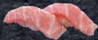
本まぐろ 大とろ 1,010円