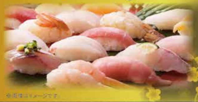
※写真イメージです

本日の 金沢まいもん 百万石握り 【五貫盛り】 内容・価格は 日替わりです。 「本日のおすすめ」を ご覧ください。