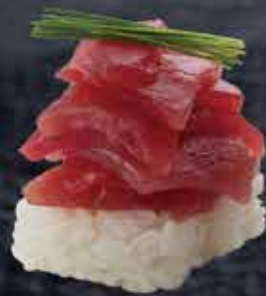
まぐろ がんに盛り 680円