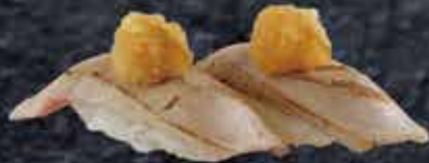
本まぐろ 中とろ あぶり 790円