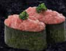
本まぐろ入り ねぎとろ軍艦 455円