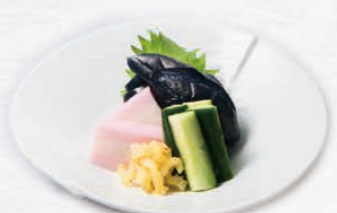
漬け物盛り合わせ