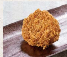
やわらかヒレかつ