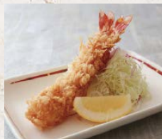
天然大えびフライ